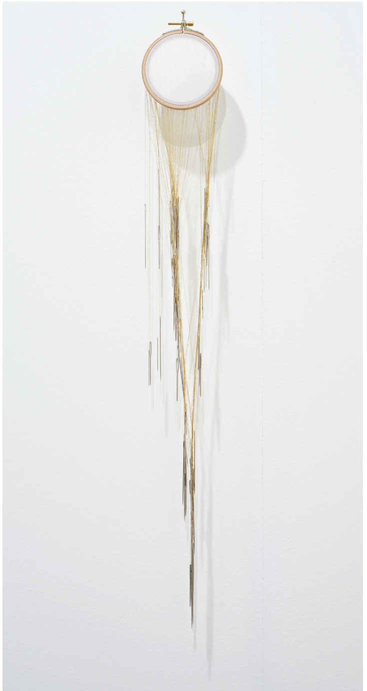
Šejla Kamerić | Missing IV | 2014 | wood, fabric, golden thread, needles | 84 x 11 cm | In collaboration with Dante Buu