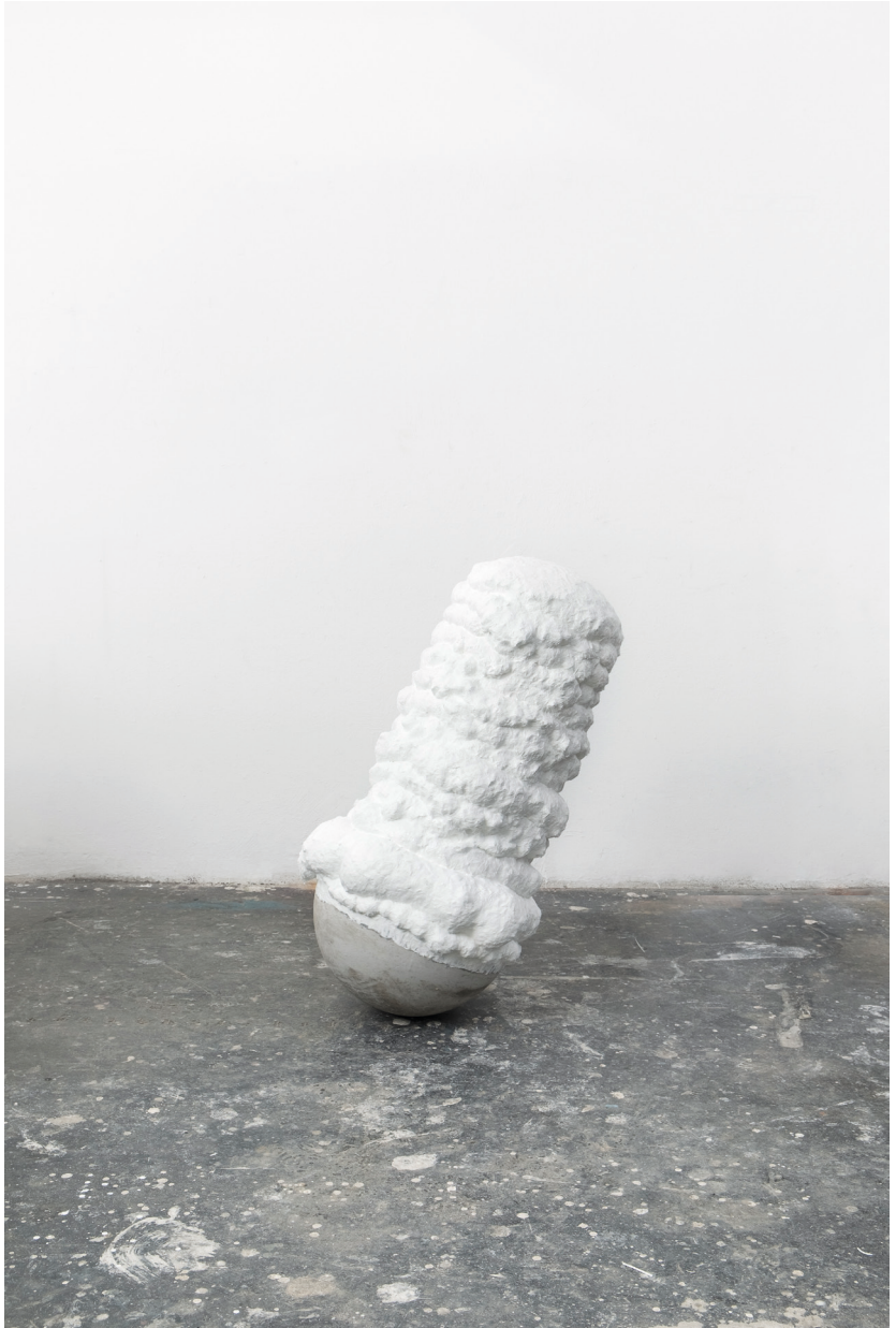
Stefan Glettler | ghost dancer | 2016 | Beton, Epoxyharz | 106 x 46 cm