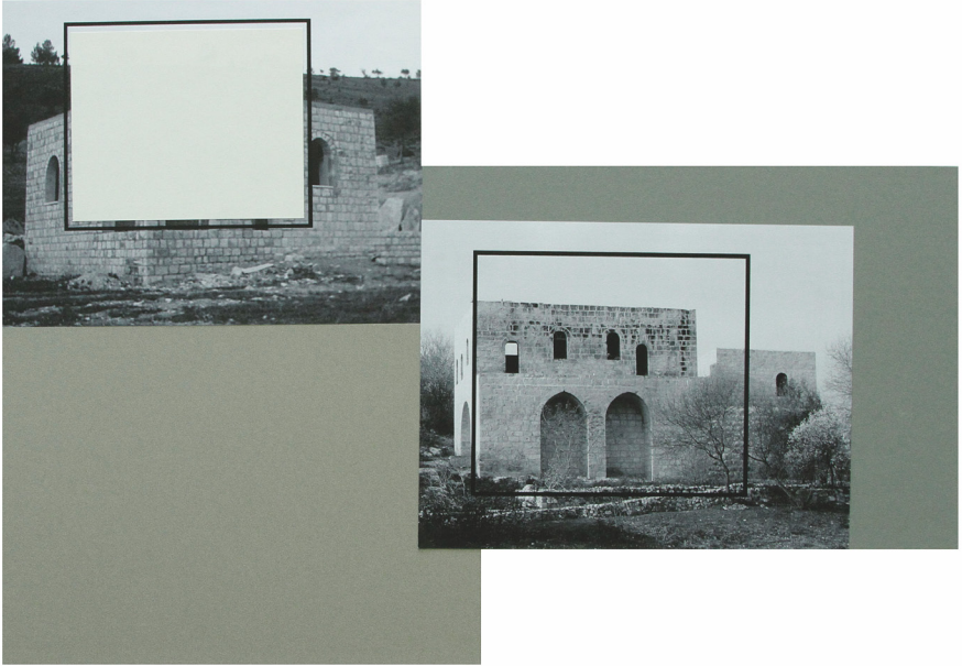
Hazem Harb | TAG04 from TAG Series | 2015 | Inkjet photo copy print and collage on fine art paper | 56 x 76 cm | Unique | Courtesy of the artist and ATHR, Jeddah