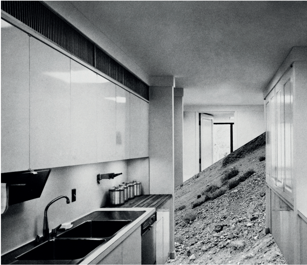
Yael Burstein | Untitled (kitchen) | 2009 | archival pigment print | 86 x 100 cm | Edition 3/5 + II AP | Inga Gallery of Contemporary Art, Tel Aviv