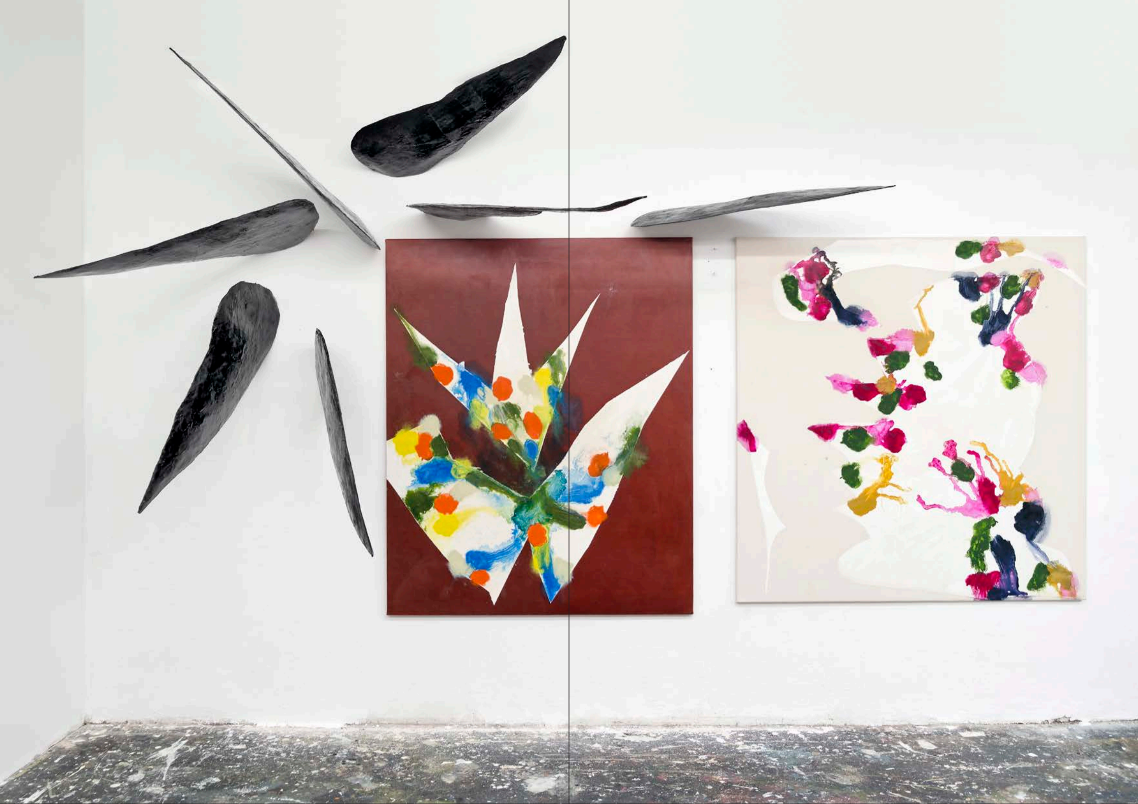
Flügel, 2022, Teer auf Holz, ca. 75 x 15 x 40 cm / spinnom X, 2024, Acryl, Tempera, Öl auf Baumwolle, 160 x 130 cm / spinnom VI, 2024, 155 x 150 cm, Öl, Acryl auf Baumwolle