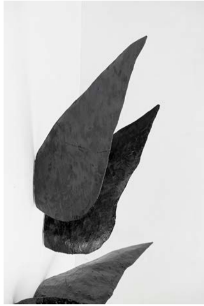
Flügel, 2022, Teer auf Holz, ca. 75 x 15 x 40 cm