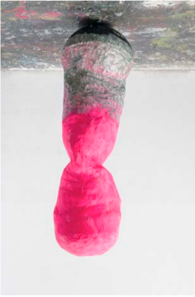
troll stone daning, 2022/2025, 180 x 62 x 62 cm, Beton/Carbon/Glasgewebe/Papier/Epoxyd